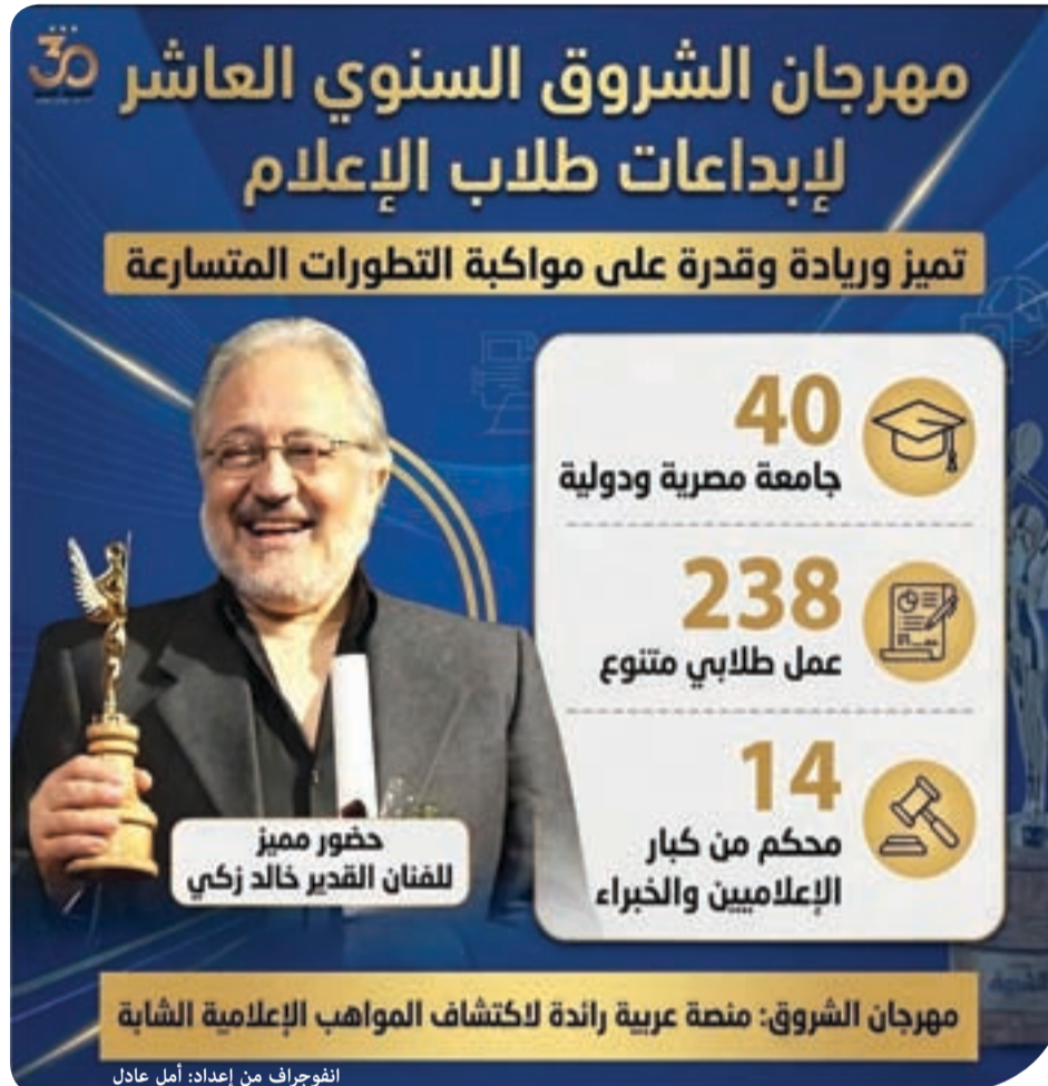
الفنان خالد زكي يحضر حفل

وتضيف «إن اختيار فنان بهذه القيمة الفنية والإنسانية إنما يأتي ليخدم لأبنائنا من الشباب ونموذجاً ملهماً وقوة في الالتزام بالفن الهادف والإبداع المسؤول. فخالص التحية والتقدير له على مشاركته معنا في هذا اليوم المميز، وعلى رسائله الداعمة لشباب الإعلام في تقديم الفن الراقي والإبداع الجميل».