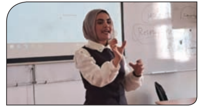
كتبت: أروى عمرو