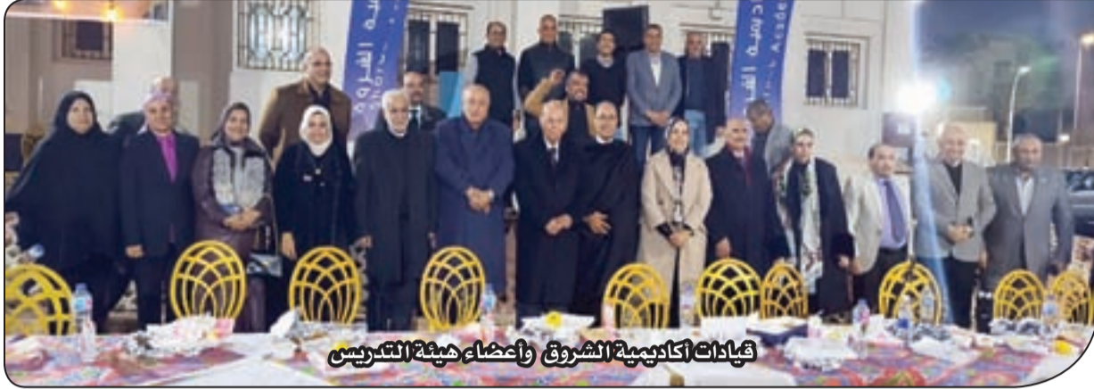
طلاب أكاديمية الشروق وأعضاء هيئة التدريس

للهندسة، والمعهد العالي للحاسبات وتكنولوجيا المعلومات، والمعهد الدولي العالمي للإعلام؛ بالإضافة إلى وكلاء المعاهد، ورؤساء الأقسام، وأعضاء هيئة التدريس، والهيئة المعاونة. وسجل الحفل مشاركة واسعة من طلاب المعاهد الثلاثة، الذين حرصوا على التواجد في هذه المناسبة التي باتت تقليدًا سنويًا يعكس روح «الأسرة الواحدة» التي تميز الأكاديمية، ويعزز مشاعر الانتماء والفخر بالمؤسسة. وأكدت قيادات الأكاديمية خلال الحفل أن الإفطار الجماعي لا يقتصر على كونه مناسبة اجتماعية، بل يمثل رسالة واضحة بأن العلاقات الإنسانية تعتبر ركيزة أساسية في بناء مجتمع أكاديمي متماسك؛ مُشددين على استمرار تنظيم مثل هذه الفعاليات التي تعمق أواصر الترابط داخل الحرم الجامعي.