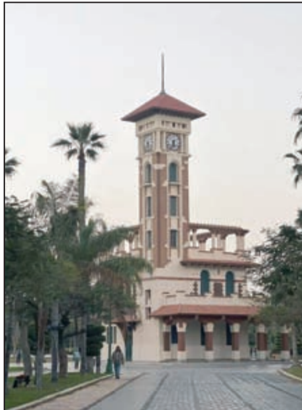
قصر المنزه