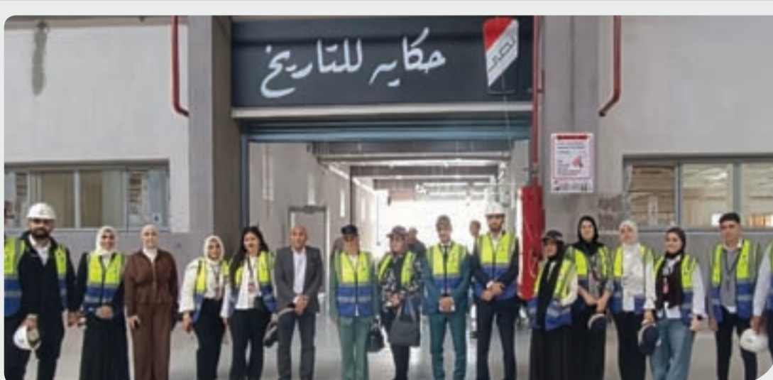
طلاب قسم العلاقات العامة والإعلان خلال الزيارة