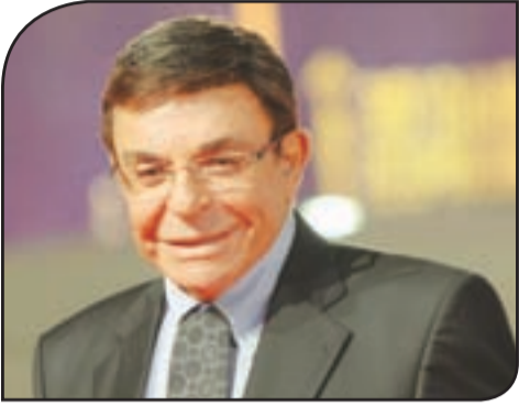
الفنان الراحل سمير صبري