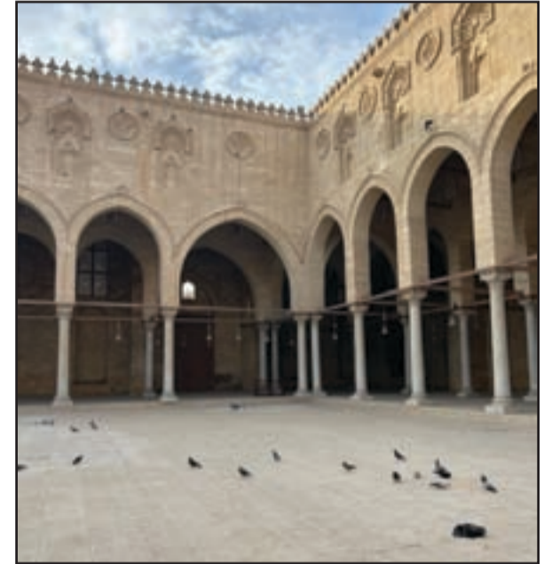
الأزهر الشريف