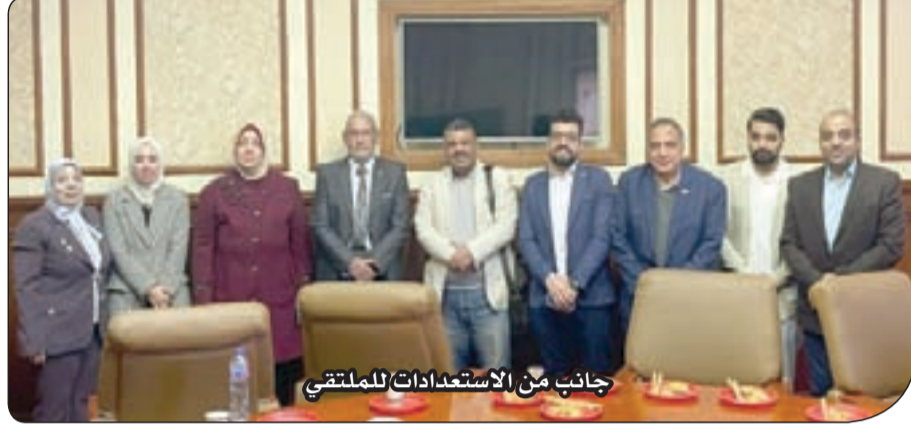
جانب من الاستعدادات للملتقى