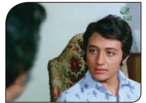
مشاهد من أعمال الفنان خالد زكي