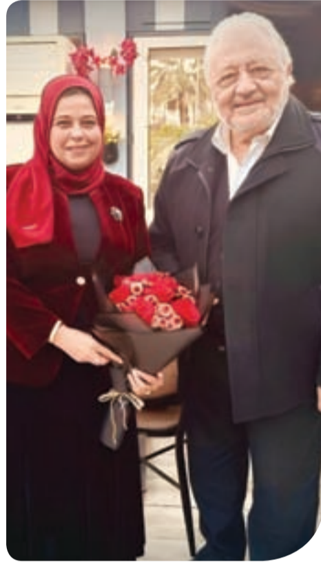
د. سهير صالح والفنان خالد زكي

وتميز خالد زكي بتقديم أدوار الرجل القوي، لكنه في الوقت نفسه نجح في كسر هذا النمط من خلال أدوار إنسانية تحمل أبعاداً نفسية عميقة،