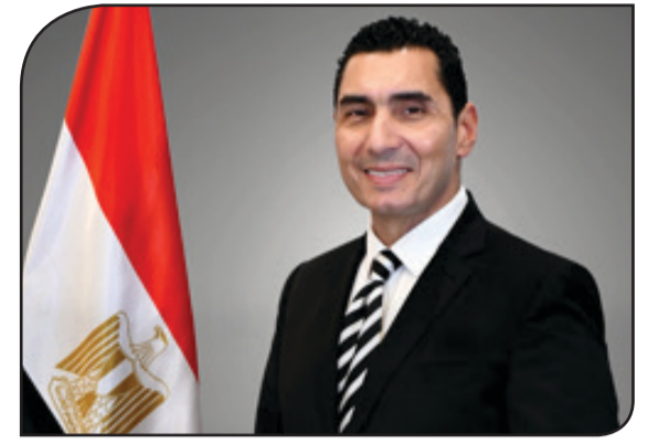
جواهر نبيل وزير الشباب والرياضة