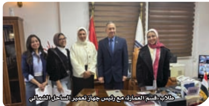
طلاب «قسم العمارة» مع رئيس جهاز تعمير الساحل الشمالي

نموذج لربط الدراسة الأكاديمية بالمشروعات القومية