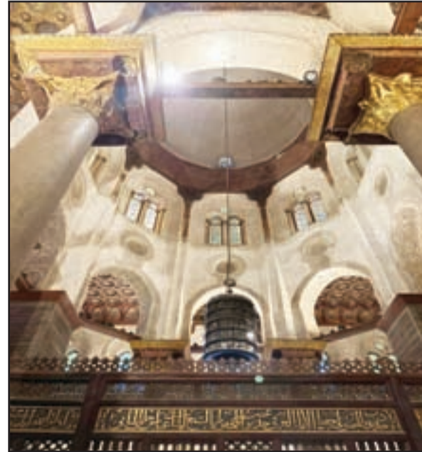
قبة السلطان