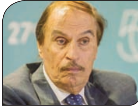
الفنان الراحل عزت الغلايلي