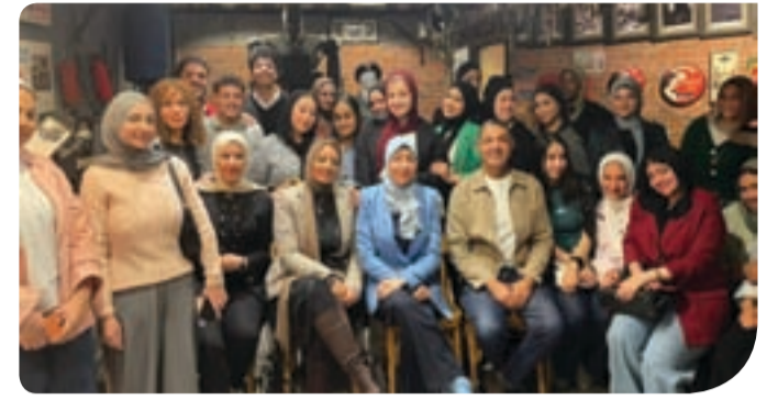
طلاب قسم الإذاعة والتلفزيون خلال زيارة متحف السينما المصرية