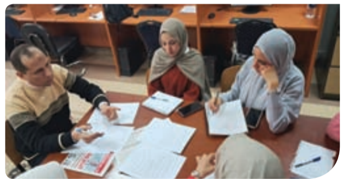
جانب من فعاليات الورشة