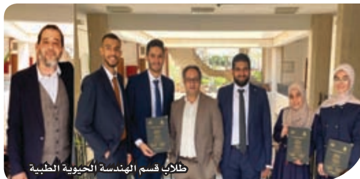
طلاب قسم الهندسة الحيوية الطبية

وأكد الفريق أن المشاركة في المسابقة مثلت تجربة علمية متميزة، ساهمت في تطوير المشروع، وتعزيز قدراتهم على ربط المعرفة الأكاديمية بحلول واقعية تخدم المجتمع؛ مشيرين إلى أن الهدف الأساسي من المشروع هو توظيف التكنولوجيا لتحسين جودة حياة الأشخاص ذوي الإعاقة البصرية، ومنحهم مزيداً من الاستقلالية والنقطة. ويعكس هذا الإنجاز المستوى العلمي والبحثي لطلاب أكاديمية الشروق، وقدرتهم على المنافسة في المحافل الدولية، من خلال تقديم حلول تكنولوجية مبتكرة تستجيب لاحتياجات