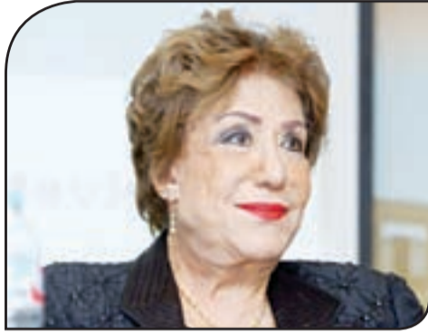
الفنانة الراحلة سميحة أيوب