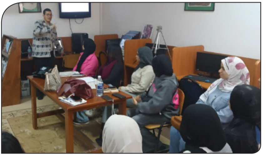
الطلاب خلال الورشة التدريبية المتخصصة

الجمهور. وتضمنت الورشة شرحاً أساسياً لإعداد حلقات البودكاست، بدءاً من اختيار الفكرة، وتحديد الجمهور المستهدف؛ مروراً بمرحلة البحث وكتابة الإعداد؛ وصولاً إلى مهارات التسجيل الاحترافي، وأساليب تحسين جودة الصوت، والتعرف على أهم البرامج المجانية المستخدمة في المونتاج الصوتي، كما شملت تدريب الطلاب على مهارات الأداء الصوتي، وأساليب الإلقاء والتقديم، إلى جانب التعرف على أدوات تحقيق الترخيص من محتوى البودكاست، بما يساهم على تقديم محتوى صحفي جذاب ومؤثر. وشهدت الورشة تفاعلاً كبيراً من الطلاب، حيث أتيح لهم فرصة مناقشة أفكار مختلفة لمشروعات بودكاست صحفية يمكن تنفيذها خلال الفترة المقبلة.