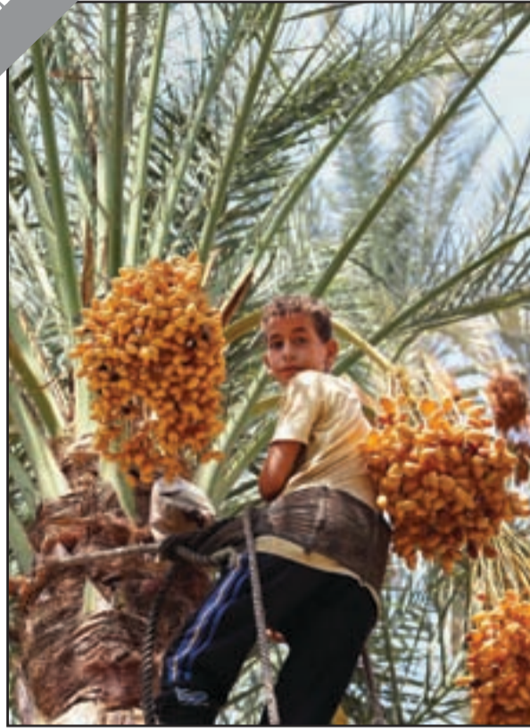
يا طالع النخلة