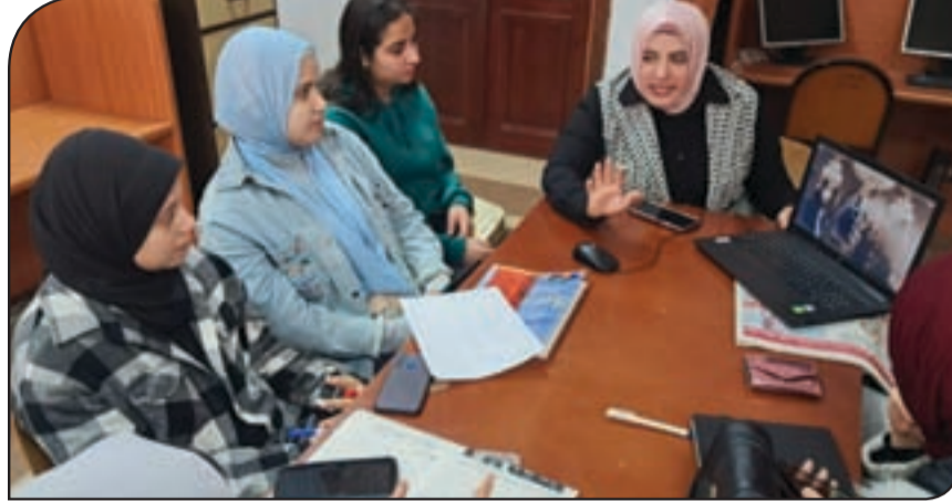
الطلاب خلال الورش التدريبية المتخصصة