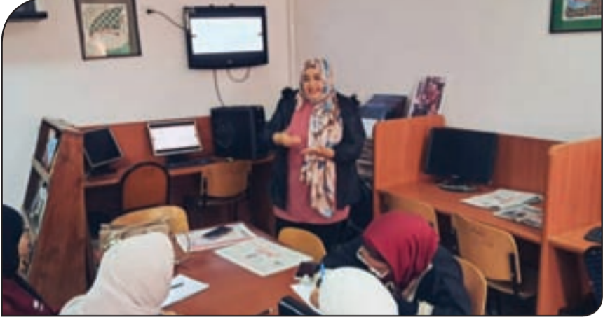
الطلاب خلال الورش التدريبية المتخصصة