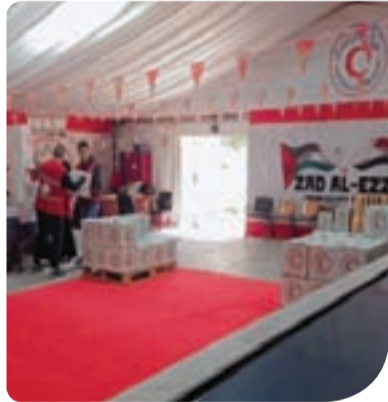
مشاركة الطلاب في تجهيز كراتين رمضان

في خطوة عملية لتعزيز العمل التطوعي، شارك طلاب المعهد الدولي العالي للإعلام في مبادرة الهلال الأحمر المصري لتجهيز «كراتين رمضان» مخصصة إلى الأسر الأكثر احتياجاً، ضمن جهود المؤسسة لتوفير الدعم الغذائي خلال الشهر الكريم. وجاءت الزيارة تعريف الطلاب بطبيعة العمل التطوعي والخيري على أرض الواقع، وتمكينهم من المشاركة الفعالة في تجهيز المساعدات الغذائية بطريقة منظمة وفعالة، حيث شارك الطلاب في مركز التوعية بمختلف المهام الميدانية، من فرز المواد الغذائية الأساسية، إلى تعبئتها في الكراتين بشكل منظم، متضمنة المواد الرئيسة: مثل: الأرز، المكرونة، الزيت، السكر، وغيرها من السلع الأساسية لضمان وصولها بشكل كامل ومترتب إلى الأسر الأكثر احتياجاً. وأكد المسؤولون في الهلال الأحمر أن إشراك الشباب في مثل هذه المبادرات يعزز روح التعاون، ويُرسخ قيم المسؤولية الاجتماعية، كما يمنح الطلاب خبرة عملية في تنظيم وإدارة العمل التطوعي، وشهدت القاعة أجواءً حيوية مليئة بالحماس وروح الفريق، حيث عمل الطلاب