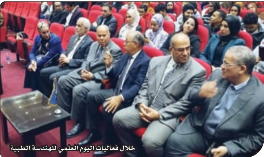
خلال فعاليات اليوم العلمي للهندسة الطبية

أقيمت الفعاليات بقاعة (د)، بينما استضافت (ب) مجموعة من الورش التطبيقية المتخصصة، وسط حضور عدد من القيادات الأكاديمية والتنفيذية بأكاديمية الشروق، وممثلي كبرى الشركات العاملة في مجال الأجهزة الطبية والتكنولوجيا، إلى جانب أعضاء هيئة التدريس، وطلاب القسم. ويهدف اليوم العلمي إلى إتاحة الفرصة أمام الطلاب للتفاعل المباشر مع الشركات والمؤسسات المتخصصة، والتعرف على متطلبات سوق العمل، والمسارات المهنية المختلفة في مجالات الهندسة الطبية، بما يعزز من جاهزيتهم المهنية، ويساعدهم على بناء مسارات وظيفية واضحة منذ سنوات الدراسة.