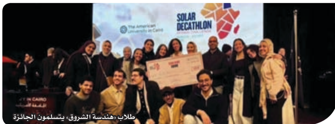
طلاب «هندسة الشروق» يتسلمون الجائزة

وجاء الفوز من خلال فريق «Archivision»، الذي مثل نموذجاً ناجحاً للتعاون الأكاديمي، حيث ضم طلاباً من أكاديمية الشروق إلى جانب زملائهم من جامعة كاييتال (كلية جنوب الجميلة)، في تجربة عكست قوة العمل