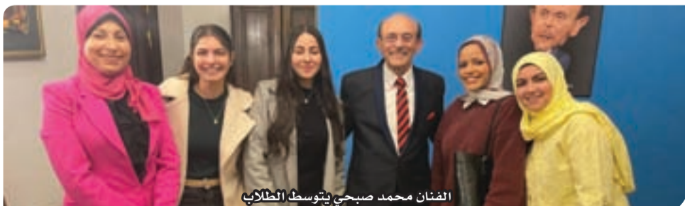
الفنان محمد صبحي يتوسط الطلاب

الدولي للكتاب ٢٠٢٦، وشهدت الندوة حضورًا لافتًا بمشاركة المنتج عمرو قورة، والمنتج هشام سليمان، والفنان والإعلامي محمد نشأت، والفنانة شيري أشرف، فيما أدارت اللقاء الإعلامية الدكتورة هبة حمزة، بأسلوب مهني راق، أسهم في إثراء النقاش.