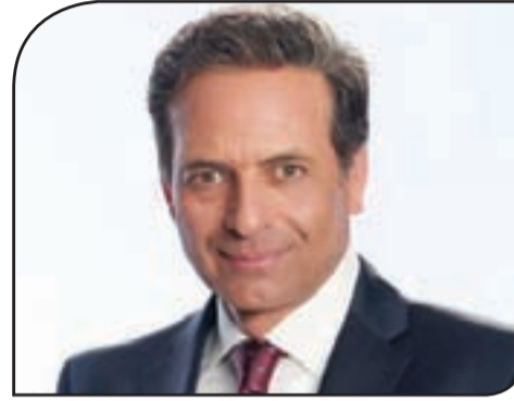
الفنان الراحل ممدوح عبد العليم