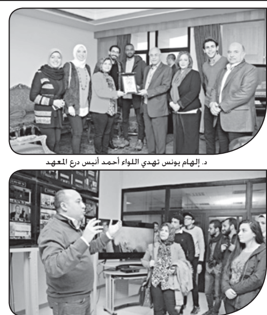
الطلاب في جولة تفغيبية